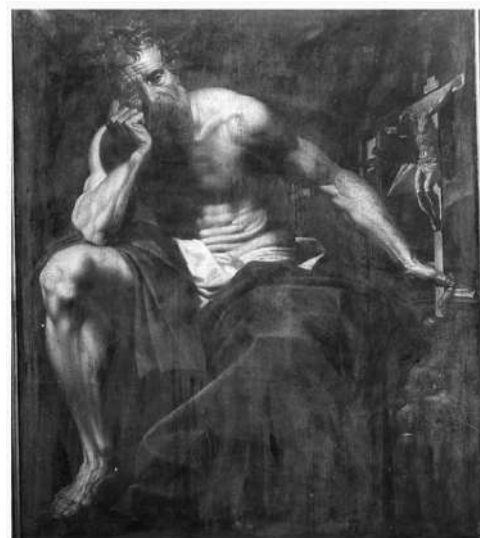
Janssens - Sint-Niklaaskerk, Gent