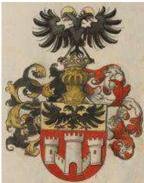
Wapen markgraafschap Antwerpen rond 1600