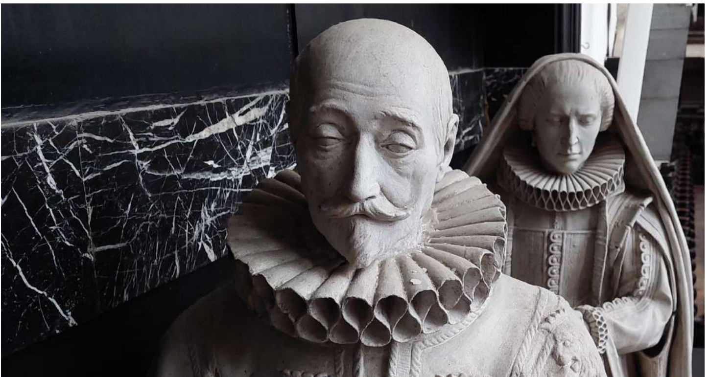
Grafmonument Van Varick - Damant, detail. Sint-Pauluskerk Antwerpen. Eigen foto

https://www.sintpaulusantwerpen.be/publicatie-categorie/paullus/