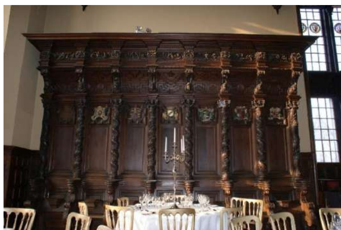
Originele koorstoelen uit Sint-Paulus aangevuld met ter plaatse gesculpteerde stoelen in Adare Manor

Waar al de geveilde goederen gebleven zijn is niet bekend. In het dagboek van Lady Dunraven over haar grote reis (Grand Tour) door de Nederlanden en Duitsland noteerde ze dat haar man eind september 1835 'some beautiful carvings from the St-Paul's church Antwerp' had gekocht om hun in opbouw zijnde kasteel in Adare Manor (Ierland) te decoreren. Het kasteel is nu een luxehotel.