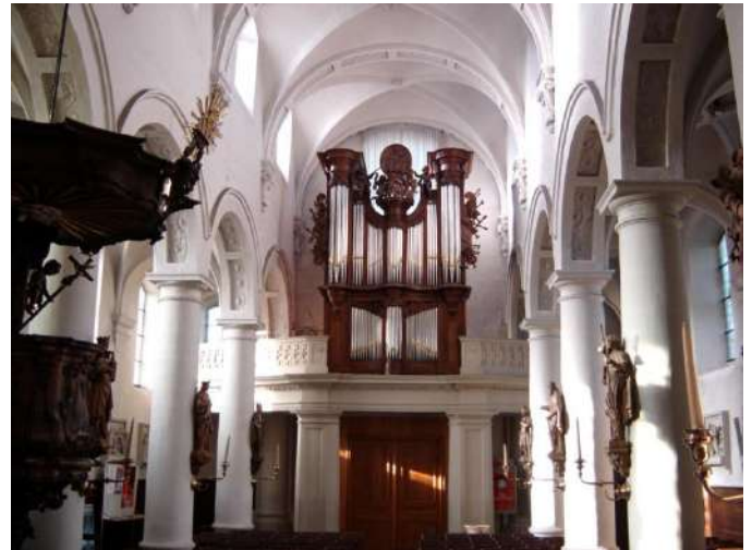
Zilveren Orgel, Onze-Lieve-Vrouwkerk van Broechem

Het koorgestoelte werd langs de twee zijden in een L-vorm geplaatst. Vandaag bestaat het uit twee rechte stukken. De L-vorm is verdwenen. In 1833 werd de koorafsluiting met orgel en twee altaren afgebroken. Het koororgel (Zilveren Orgel) van Forceville werd verkocht aan de parochiekerk van Broechem, waar het zich nog steeds bevindt. Door de afbraak kreeg men een onbelemmerde doorkijk naar het hoofdaltaar.