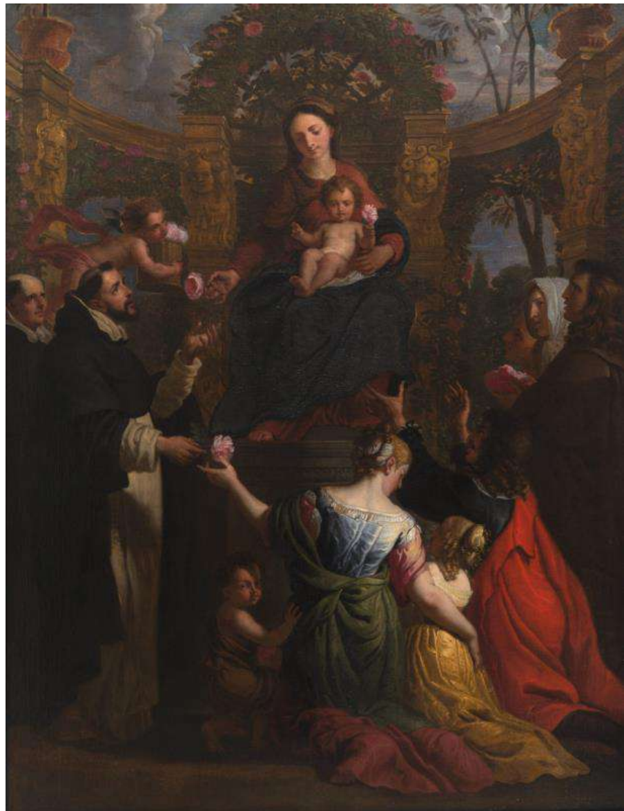
Erasmus II Quellinus, Maria met kind en Heilige Dominicus, olieverf op doek, 206 x 164, 1656

Erasmus II Quellinus was zowel een leerling als een medewerker in het atelier van Rubens. In het vierde decennium van de 17de eeuw werkte hij mee aan de versieringen van het jachtpaviljoen Torre de la Parada in de buurt van Madrid en aan de versieringen van de praalwagens voor de Blijde Inkomst van kardinaal en infant Ferdinand (1609 – 1641) in Antwerpen in 1635. Na de dood van Rubens (1640) werd hij één van de belangrijkste historieschilders in de zuidelijke Nederlanden. Daarnaast was hij ook filosoof.