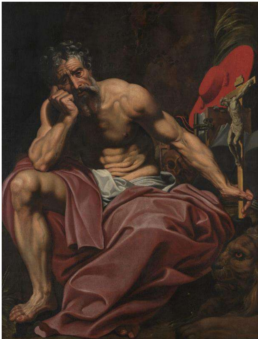
Abraham Janssens, Heilige Hieronymus, olieverf op doek, 201 x 162, 1600-1604

In de christelijke iconografie wordt Hiëronymus vaak afgebeeld met een leeuw, verwijzend naar een Griekse monnikenlegende waarin hij die leeuw van een pijnlijke doorn in zijn poot bevrijdde. Op dit schilderij staat er ook één, rechtsonder. Hij verdwijnt wat in de achtergrond en de kerkvader bekommert zich niet om hem. Hiëronymus staat afgebeeld als een halfnaakte - weliswaar erg gespierde - grijsaard met een rode mantel rond zijn benen gedrapeerd. Met bezorgde blik en diep in gedachten verzonken. Hoewel hij nooit kardinaal was, verwijzen de rode mantel en de kardinaalshoed naar zijn belangrijke rol als secretaris en goede vriend van paus Damasus I.