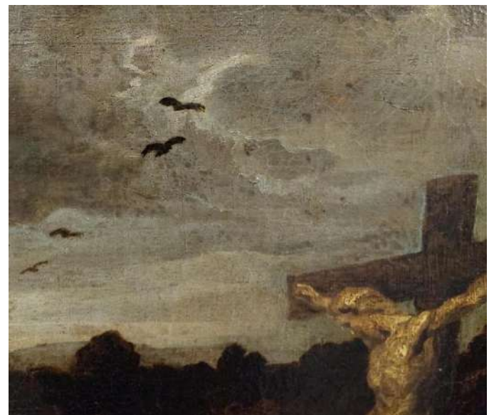
Schilderij bisdom Den Bosch 1626 - 1629, detail

Het terras lijkt gebouwd op een verdieping en biedt een ruime kijk op het landschap en de bewolkte lucht, waarin vogels zweven. Op de achtergrond zien we een bos en de aanzet tot een heuvel. Het kruisbeeld op de tafel maakt dankbaar gebruik van het contrast met de achtergrond.