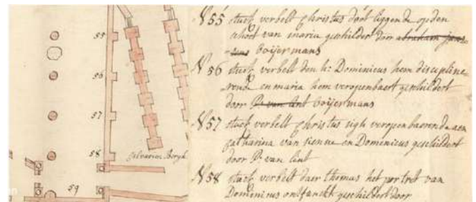
FELIXARCHIEF, Beschryvinghe van de cloosters, kercken, autaeren, etc. in de Stadt van Antwerpen, PK-0197

Nu zwaaien we onze blik helemaal naar rechts, naar de zuidelijke zijbeuk, want daar vinden we op het schilderij van Neef vier schilderijen tussen de vensters, die we kunnen vergelijken met een inventaris van onze kerk van voor 1770. De inventaris bestaat uit een plattegrond van de kerk waarop de kunstwerken zijn genummerd. Het bijbehorende register geeft per nummer de titel en de toen veronderstelde auteur van het item. Op de foto zie je links het fragment van de plattegrond en de verklaring van de corresponderende nummers 55 tot 58 voor de vier schilderijen die in 1770 aan de zuidelijke muur hingen.